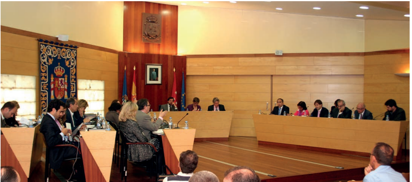
Un momento del Pleno.