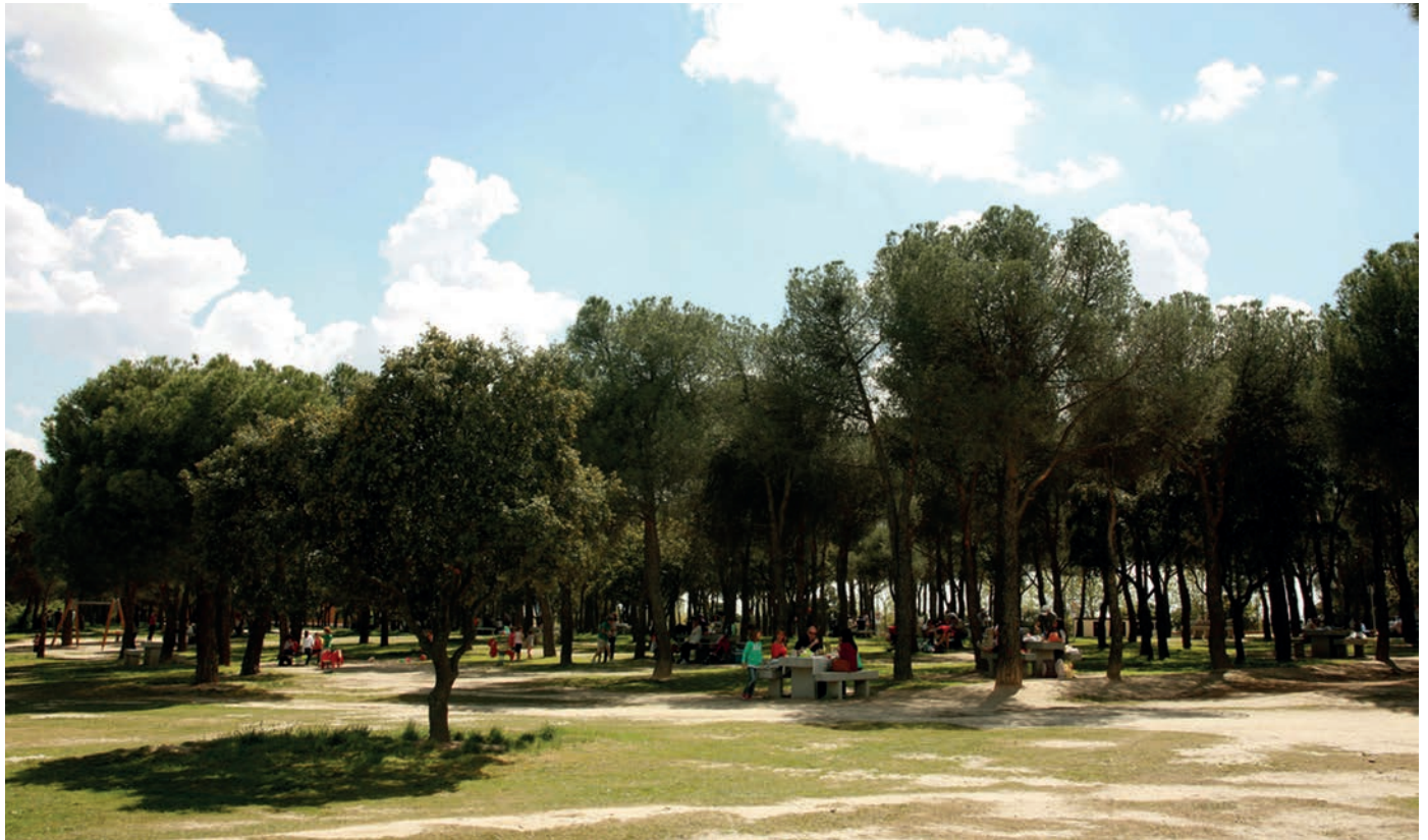
Vecinos y visitantes pueden disfrutar ya de la renovada Dehesa.

El Ayuntamiento ha repoblado las zonas afectadas por el incendio del pasado mes de agosto y está culminando las labores de poda, desbroce y mejora de la señalización de los caminos más utilizados