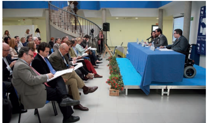
Un momento del acto de constitución del Consejo Municipal de la Discapacidad.

Entre las funciones de este Consejo está la realización de estudios, dictámenes, informes o peticiones para asesorar al Ayuntamiento en temas relacionados con las personas con discapacidad, como la eliminación de barreras arquitectónicas o su participación en los asuntos municipales que les afectan más directamente. En el trans-