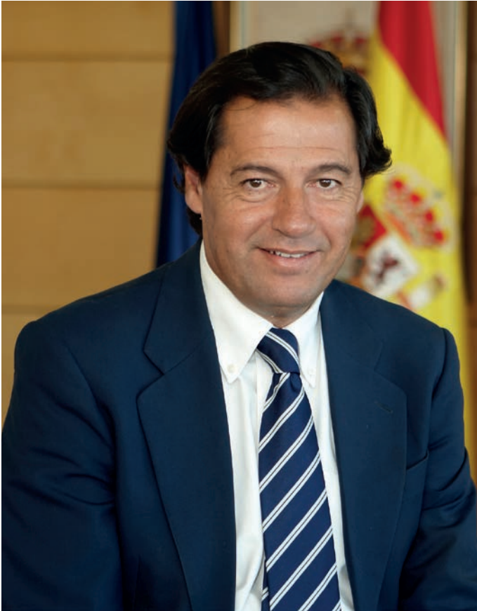
José Ignacio Fernández Rubio Alcalde-Presidente

En este nuevo número del Boletín Informativo Municipal hemos destacado la finalización de los trabajos de mejora efectuados en la Dehesa de Navalcarbón tras el incendio que afectó a este entorno el pasado mes de agosto, dejándola lista para que vecinos y visitantes podamos disfrutar ya de este espacio natural privilegiado que precisamente hace unos días ha sido escenario de una de nuestras más tradicionales celebraciones: la fiesta en honor a nuestra Patrona, la Virgen del Retamar. Por su parte, el barrio de Las Matas también acaba de vivir sus fiestas de San José, en las que hemos tenido la oportunidad de reunirnos para participar en las diferentes actividades que se organizaron para la ocasión.