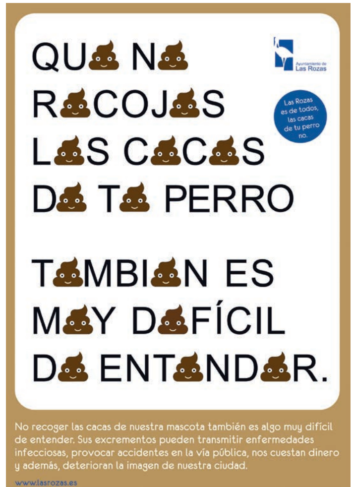
Uno de los carteles de la campaña.

Estos mensajes se harán visibles para todos los vecinos a través de carteles en marquesinas, dependencias municipales y comercios de toda la ciudad, vinilos en los vehículos municipales de limpieza, mensajes de whatsapp y acciones de concienciación dirigidas tanto a niños como a adultos.