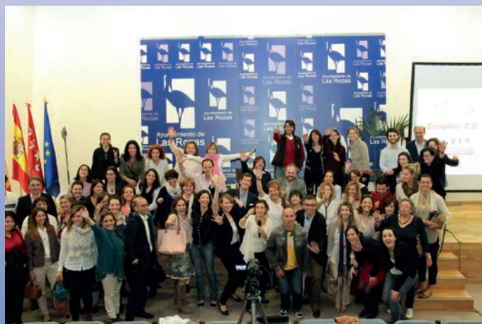
Participantes de la jornada Empleo 2.0.