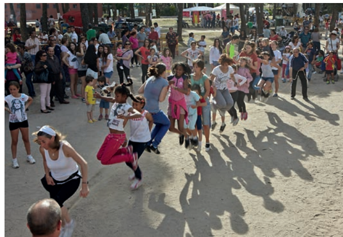
Juegos en la Dehesa de Navalcarbón para celebrar la "Retamosa".

Finalizados los actos religiosos, centenares de romeros se acercaron al pinar para degustar las paellas, asados y otras sabrosas comidas campestres. Por la tarde se celebraron distintos concursos y los vecinos también tuvieron ocasión de medir sus habilidades en juegos tradicionales, como tira de la soga, la comba, carreras de sacos y el pañuelo.