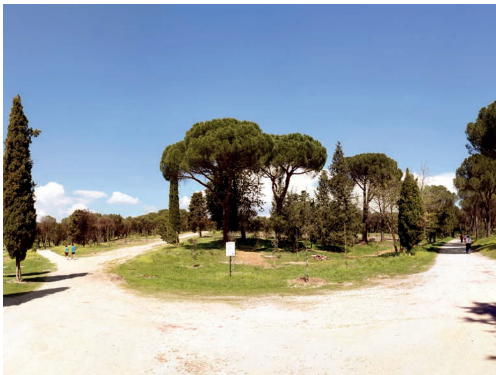
Las actuaciones han incluido la mejora de los caminos.

ha sido sin duda a reparar los efectos del incendio declarado el pasado mes de agosto, en el que el fuego dejó su huella en aproximadamente tres hectáreas de pinos y monte bajo.