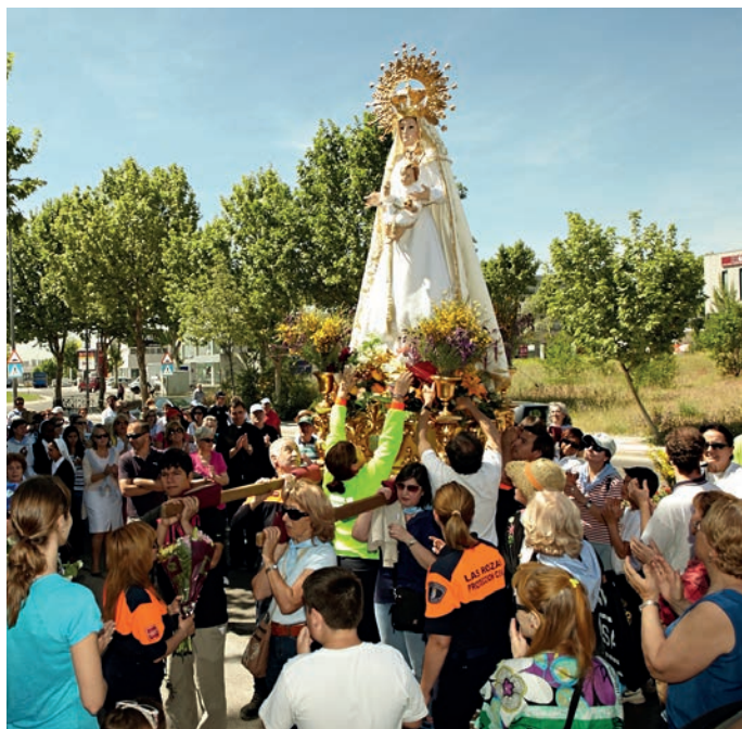
Imagen de la romería de la Virgen del Retamar.

Finalizados los actos religiosos, centenares de romeros se acercaron al pinar para degustar las paellas, asados y otras sabrosas comidas campestres. Por la tarde se celebraron distintos concursos y los vecinos también tuvieron ocasión de medir sus habilidades en juegos tradicionales, como tira de la soga, la comba, carreras de sacos y el pañuelo.