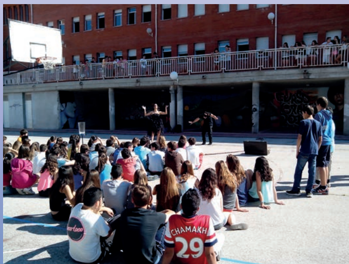
Imagen de la performance, que se realiza durante la hora del recreo.

El área de Familia y Menor vuelve a poner en marcha "¿Y tú qué sabes del alcohol?", una iniciativa dirigida a los jóvenes del municipio que, en el marco de las actuaciones que lleva a cabo el Ayuntamiento en materia de prevención de las drogodependencias, se