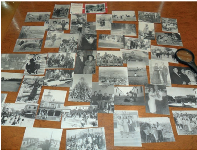
Algunas de las imágenes aportadas por los vecinos.

La memoria visual de Las Rozas ya está un poco más completa. La primera fase de la campaña de recogida de imágenes del municipio anteriores a 1980, impulsada por la Concejalía de Educación y Cultura para completar el Archivo Audiovisual del municipio, se ha saldado con un rotundo éxito de participación. Así, en apenas unas semanas las tres bibliotecas de Las Rozas han recibido cerca de 300 instantáneas aportadas por los vecinos.