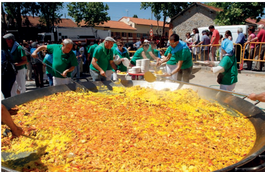
No faltó la tradicional paella en las fiestas de Las Matas.

Las celebraciones en honor a la patrona comenzaron el domingo en Las Rozas con la celebración de una misa solemne en la Iglesia de San Miguel, que precedió a la salida en procesión de la imagen de la Virgen del Retamar por las calles del centro. Al día siguiente tuvo lugar la romería, en la que las mujeres de la localidad trasladaron a hombros a la Virgen hasta la ermita que lleva su nombre, en la Dehesa de Navalcarbón.