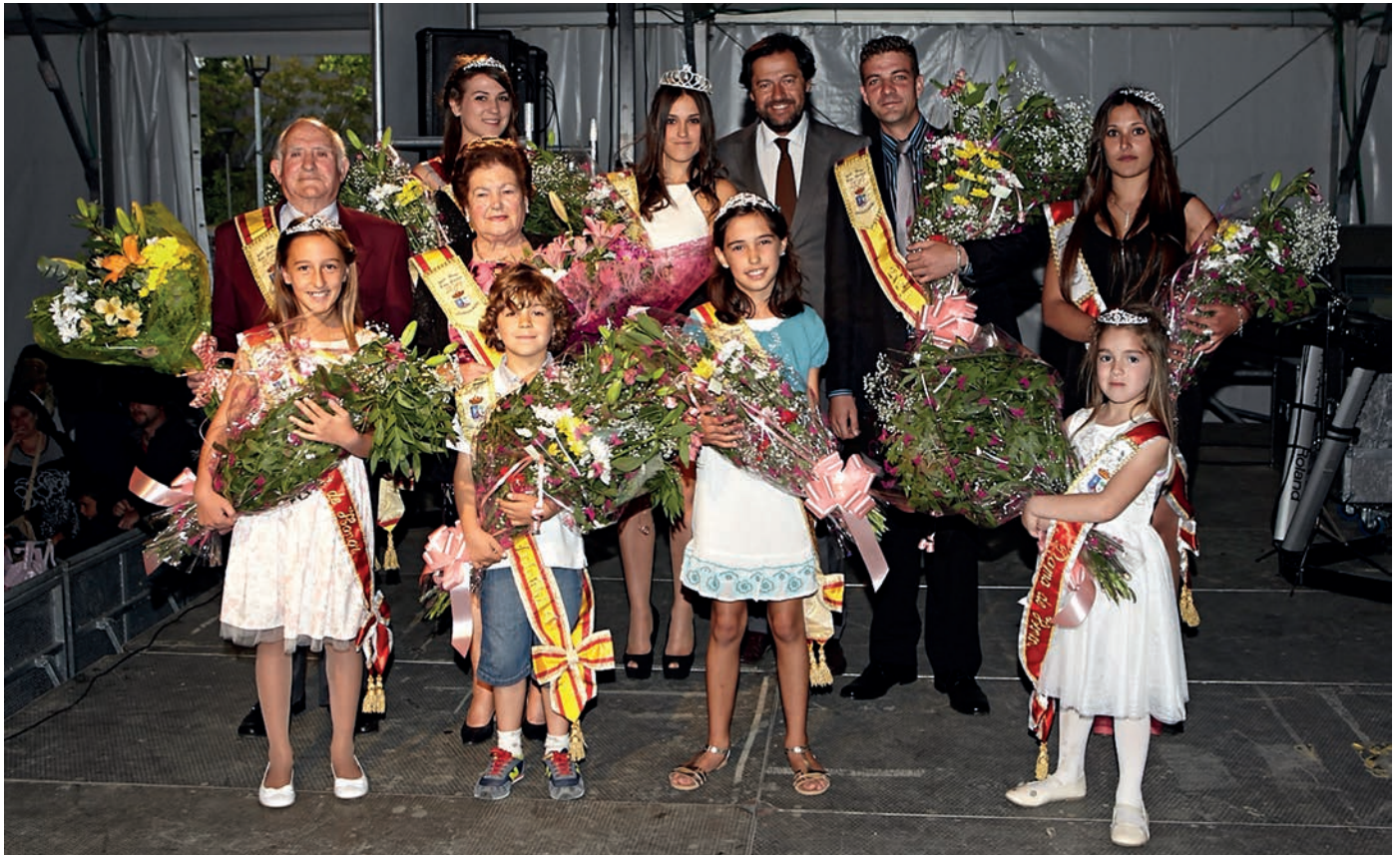
Coronación de reinas y reyes San José 2014.

Las fiestas de Las Matas arrancaron oficialmente el 30 de abril con el Pregón y la coronación de Reinas y Reyes, punto inicial de un programa en el que no faltaron actuaciones musicales, actividades para los más pequeños, sin olvidar las citas taurinas o la tradicional paella.