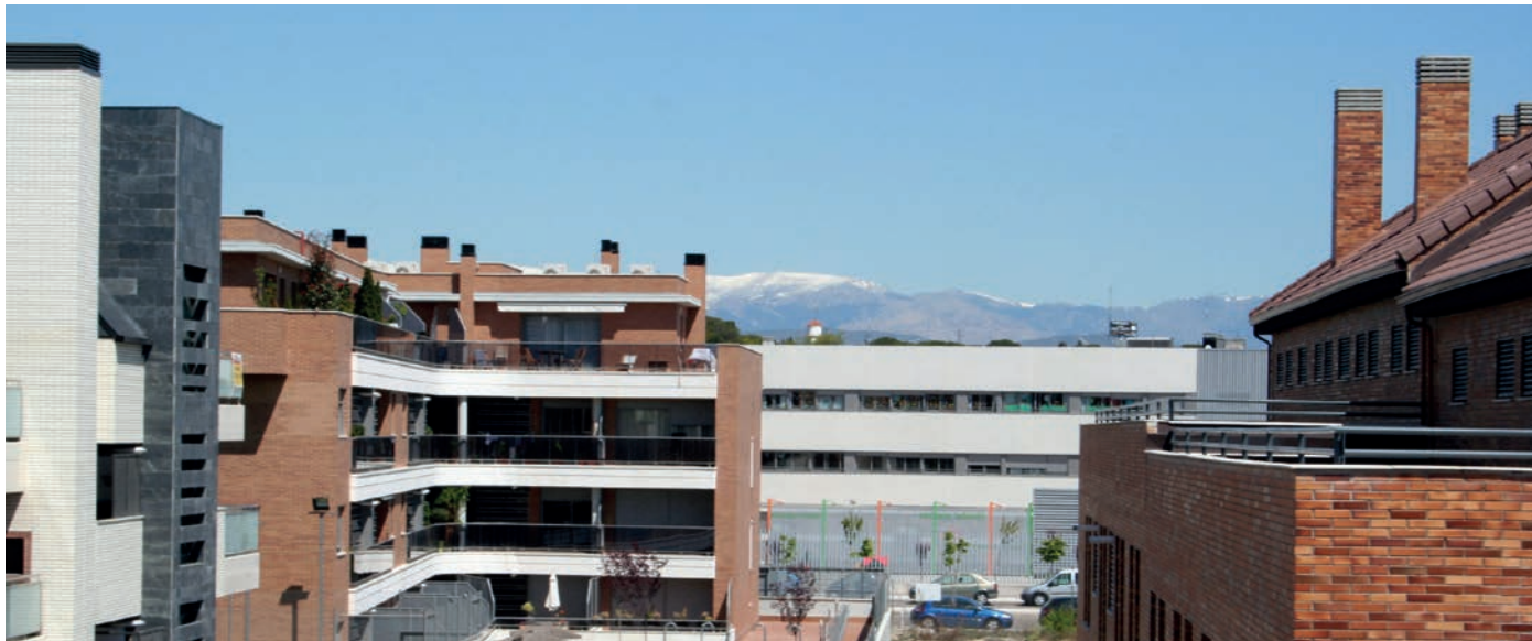
Zona residencial en Las Rozas.

El descenso supondrá una rebaja del 22% en la plusvalía y una nueva bajada media del 2% en el recibo del IBI de 2015