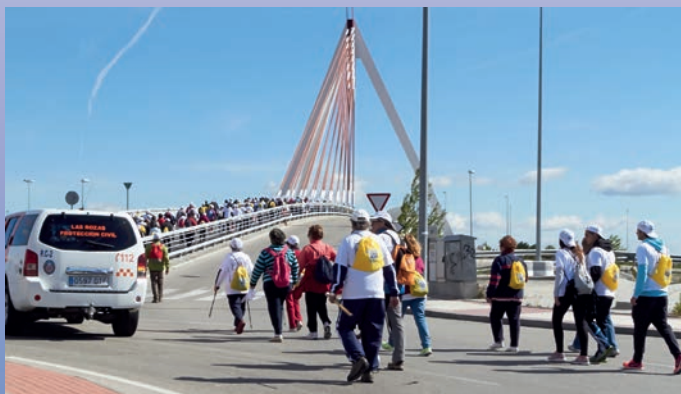
Imagen de los marchadores durante el recorrido.