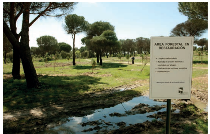
La zona, antes y después de la repoblación realizada tras el incendio.

P erdersen sus senderos paseando, en bicicleta o haciendo footing, disfrutar del entorno en fiestas populares como la recientemente celebrada Romería de la Virgen del Retamar... Son sólo algunas de las posibilidades que ofrece a vecinos y visitantes la Dehesa de Navalcarbón, una joya ambiental de 100 hectáreas situada en pleno corazón de Las Rozas que esta primavera está de “estreno”, con nuevos árboles para cerrar la herida causada por las llamas el verano pasado, mejoras en los caminos y señalizaciones, un ingente trabajo de poda que me-