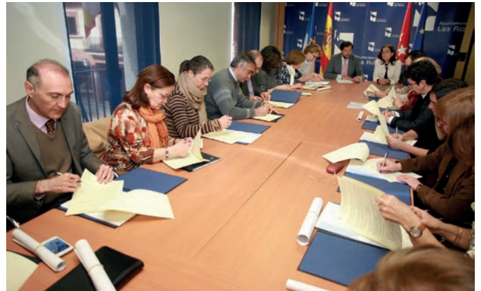
Momento de la firma del convenio.

Estas ayudas se suman a los 100.000 euros que el Ayuntamiento, a través de la Concejalía de Educación y Cultura, destina a las Asociaciones de Padres y Madres de los diez colegios públicos de Infantil y Primaria del municipio, para financiar actividades extraescolares que se desarrollan en los centros fuera del horario lectivo, reforzando