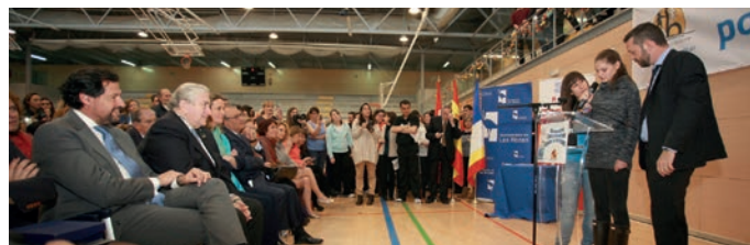
Momento de la lectura del manifiesto con motivo del Día Mundial de Concienciación sobre el Autismo.

Además de este acto se realizaron varias actividades con motivo de este Día Mundial de Concienciación sobre el Autismo en las que participó el Ayuntamiento, como la iluminación de azul de su fachada como gesto de solidaridad con las personas con TEA y sus familias, la primera Marcha solidaria por el Autismo, que se celebró en la Dehesa de Navalcarbón o las jornadas sobre este trastorno que tuvieron lugar en el CEIPSO El Cantizal, entre otras.