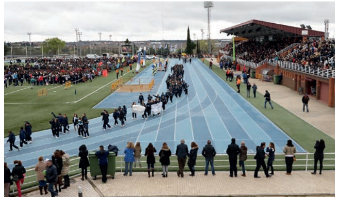
Imagen del desfile de los participantes.