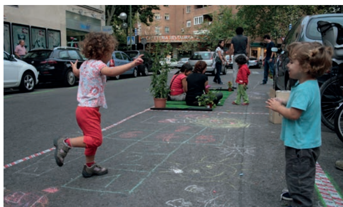
El proyecto "Camino Escolar" quiere fomentar que los alumnos se desplacen a pie hasta los colegios.

Durante los meses de abril y mayo los profesores han empezado a recibir talleres y a diseñar las actividades para sus clases. Además se ha realizado una encuesta sobre cómo es hoy el camino de cada niño hasta el centro escolar y cómo era hace unos años. El proyecto también pretende implicar a las familias de los escolares, por lo que en breve se realizarán talleres itinerantes con los padres y madres y con sus hijas e hijos. Toda la información sobre la iniciativa está disponible en de los propios colegios, con sus directores o jefes de estudios, y se puede solicitar por correo electrónico en la dirección caminoescolarlasrozas@hotmail.es .